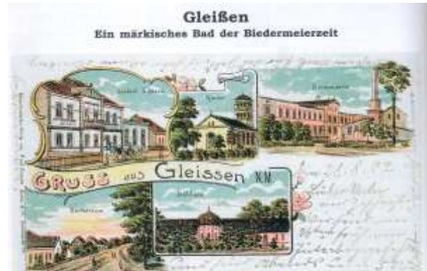
Gleißen N.-M. Gottsch. J. Stadt, evang. Kirche, Seidenstickerei, Dorfstraße und Schloß Postkarte aus dem Jahre 1902