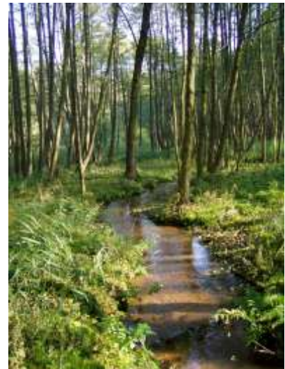
Lasy okolic Glisna