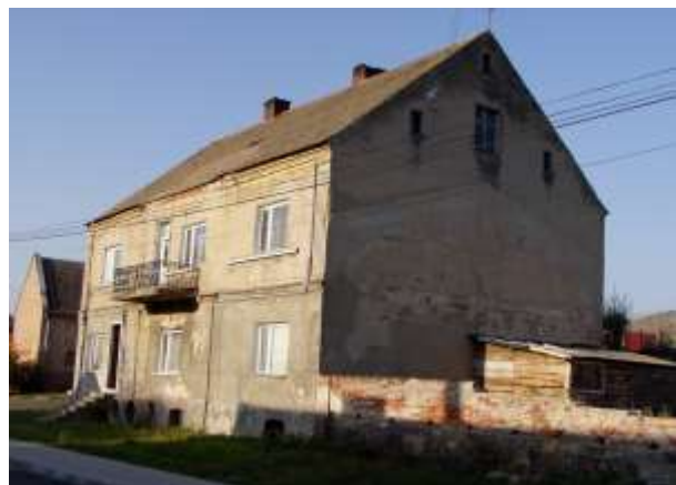
Jeden z budynków mieszkalnych nr 45