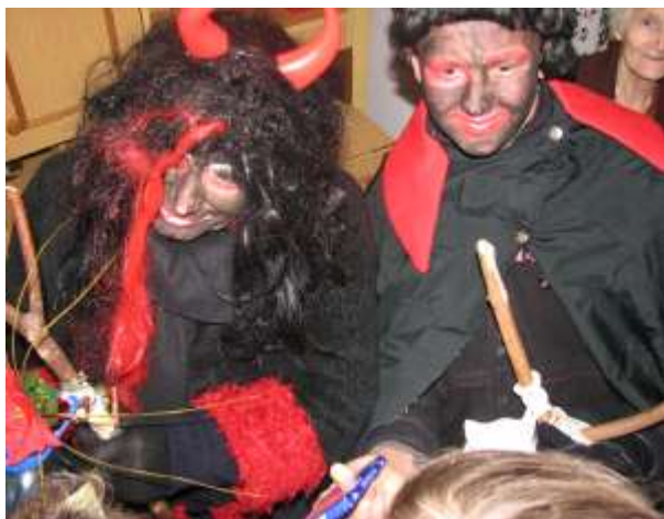
Tradycje kolędowania (2007)