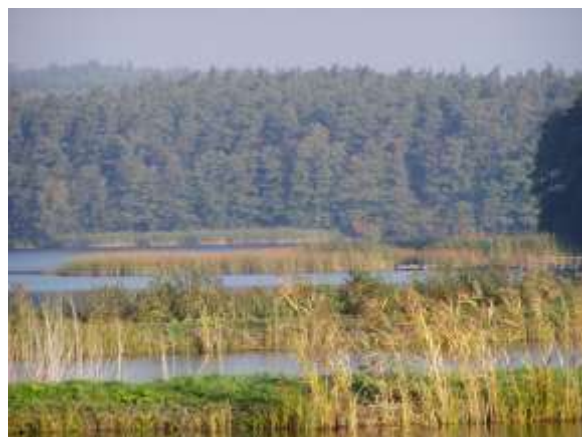
Stawy przy jeziorze Lubniewsko

Wieś o charakterze rolniczym, 72 gospodarstwa rolne, w tym: