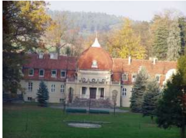
Pałac Glisno – widok od strony ruiny