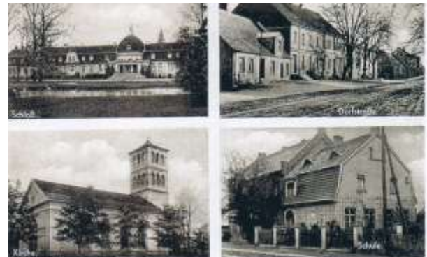
Gleißen N.-M. Schloß und Gutshof, Dorfstraße, Kirche und Schule Postkarte von 1935