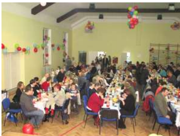
Spotkanie oplatkowe (2007)