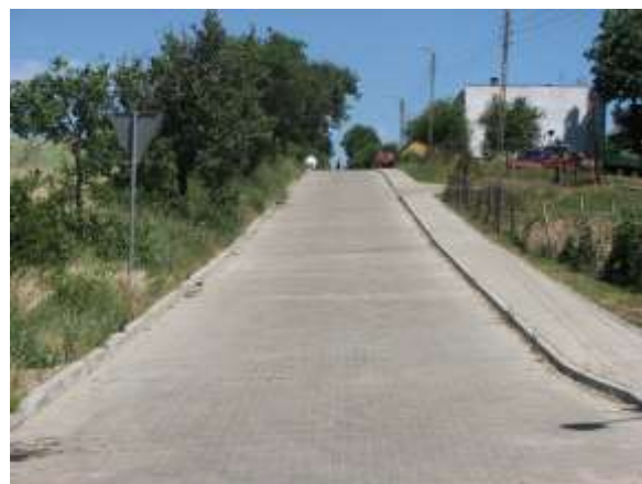
I po modernizacji