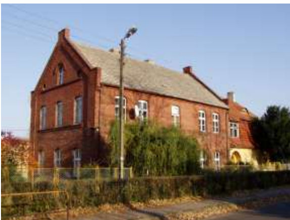
Stara część budynku po byłej szkole podstawowej (obecnie świetlica wiejska, przedszkole i punkt biblioteczny)