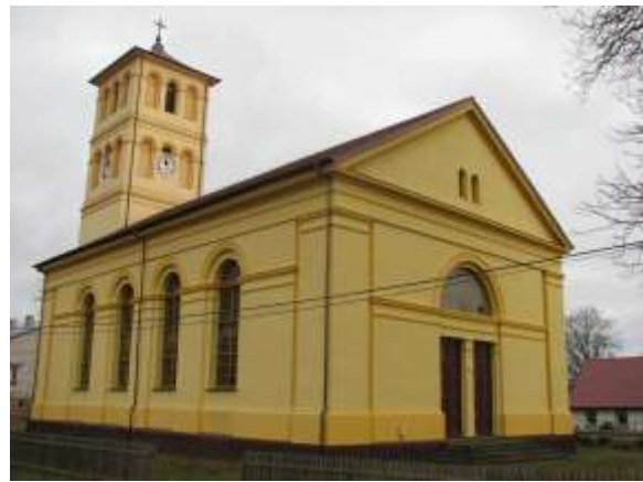
Zdjęcie po remoncie