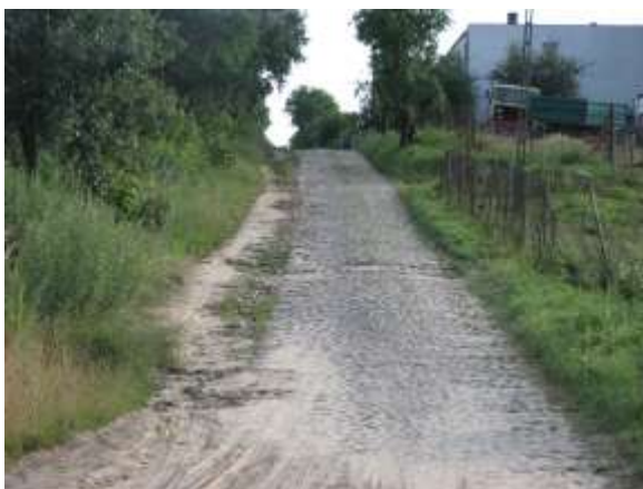
Droga gminna przed modernizacją