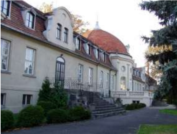
Pałac Glisno – wejście frontowe