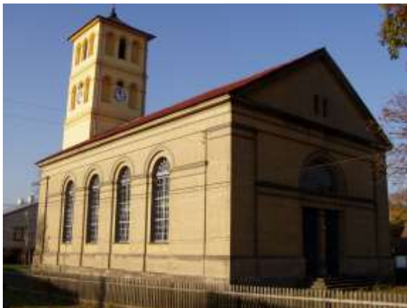
Kościół w Gliźnie – zdjęcie przed remontem