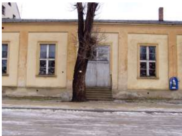
Sala widowiskowo-sportowa przez remontem