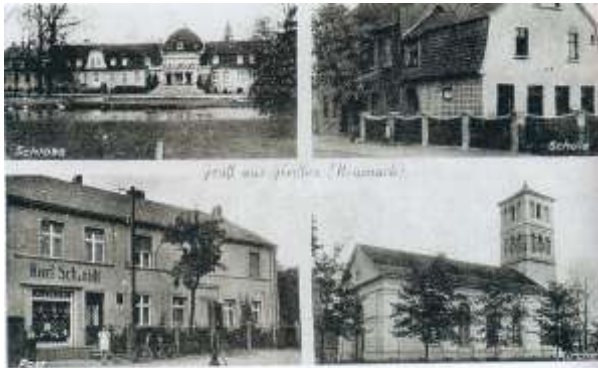
Gleißen N.-M. Schloß und Gutshaus (erbaut 1793), Schule, Postamt und Kirche