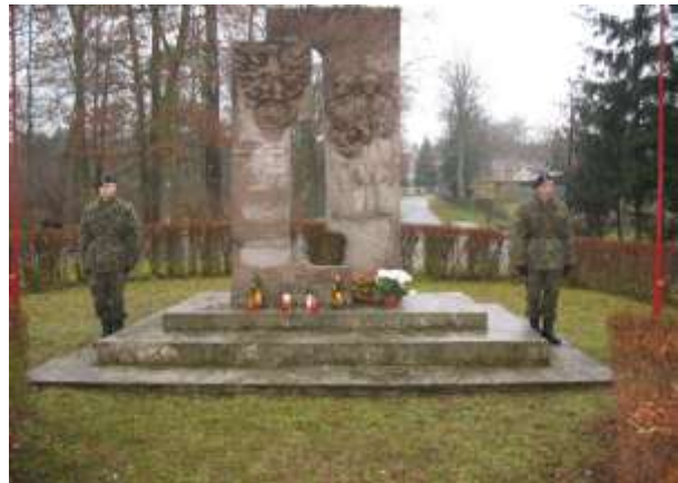
Pomnik im. Osadników Wojskowych