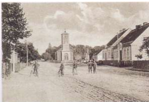
Gruß aus Gleissen, Neumark