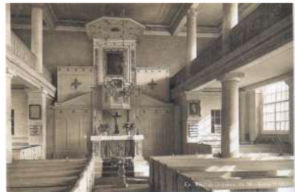
Gleißen N.-M. Evangelische Kirche, Inneres