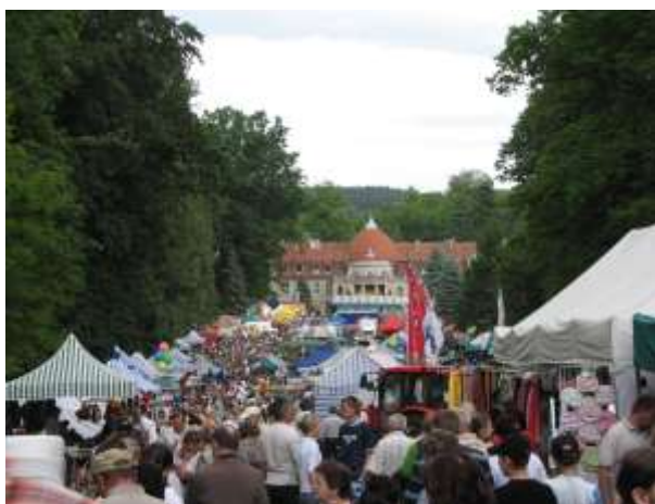
Targi Rolnicze (2007 r.)