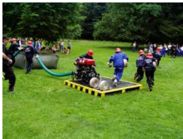
Zawody strażackie (2005)