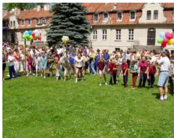
Dzień Dziecka - Powitanie Wakacji (2005)